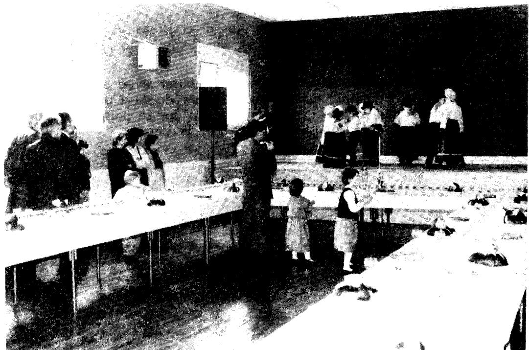
L'accueil à la salle des fêtes par le groupe "OL TAIT D'AUT'FE"

Monsieur le Ministre, Monsieur le secrétaire général, Monsieur le Conseiller Général, Monsieur l'Inspecteur d'académie, Monsieur l'Inspecteur départemental, Messieurs