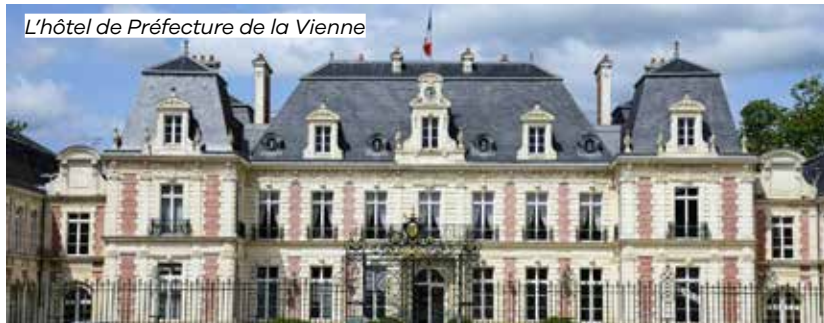
L'hôtel de Préfecture de la Vienne

© Devant les grilles de la Préfecture, place Aristide-Briand – Poitiers