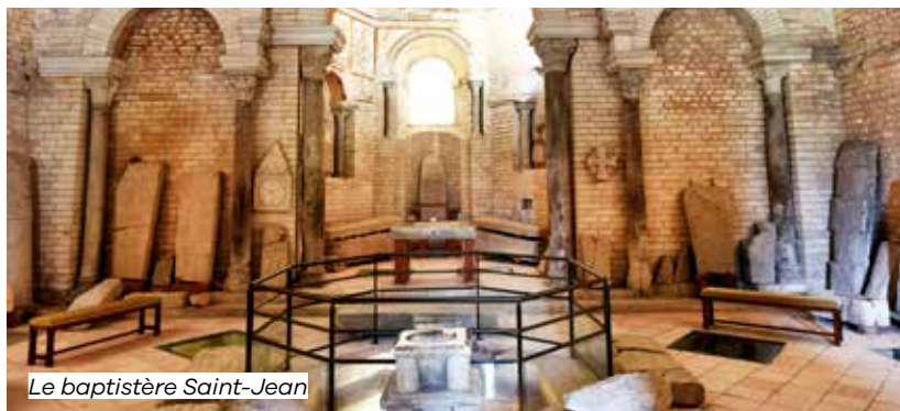
Le baptistère Saint-Jean