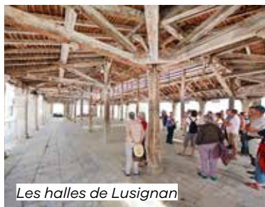
Les halles de Lusignan

📍 Rue Saint-Louis (place des Halles) Lusignan