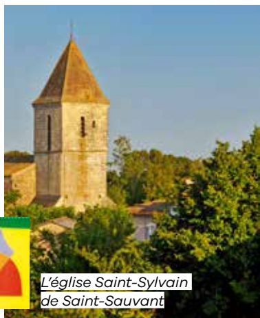
L'église Saint-Sylvain de Saint-Sauvant