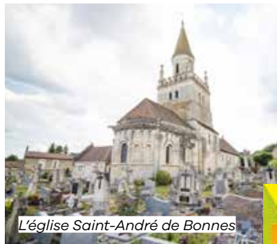
L'église Saint-André de Bonnes