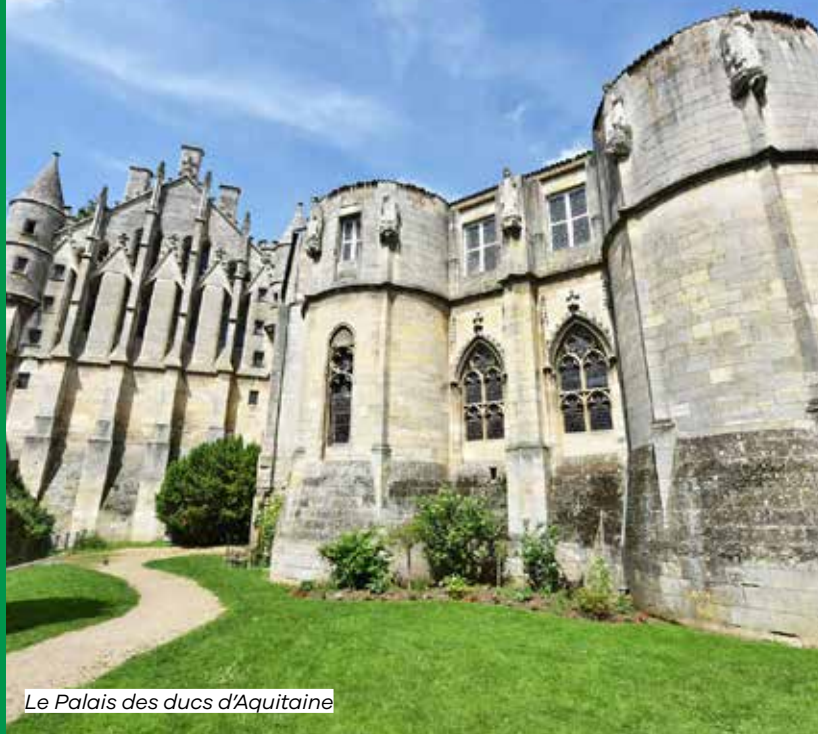
Le Palais des ducs d'Aquitaine