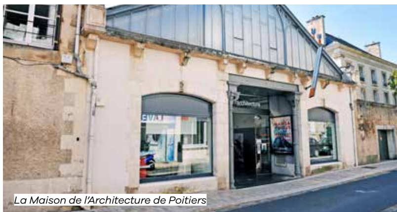
La Maison de l'Architecture de Poitiers

Découvrez cette architecture de la fin du 19 e siècle, une réhabilitation d'un ancien garage en lieu culturel, un des rares réemplois de bâtiment industriel en centre-ville de Poitiers.